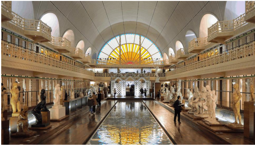
La Piscine de Roubaix aujourd'hui

Quels sont les points communs entre la Piscine actuelle et celle de 1932 ?