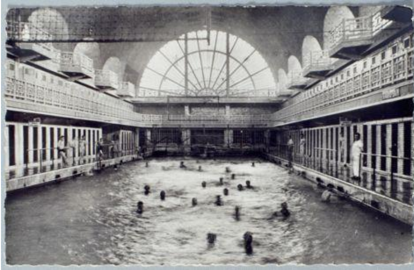
La Piscine de Roubaix en 1932

Nous avons vu pourquoi et comment le centre Beaugrenelle a été démoli puis reconstruit. Nous allons maintenant étudier pourquoi et comment la Piscine de Roubaix, qui fait partie du patrimoine industriel du Nord que nous venons d'étudier, a été réhabilitée.