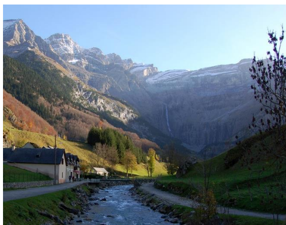
Gavarnie en été (Pyrénées)