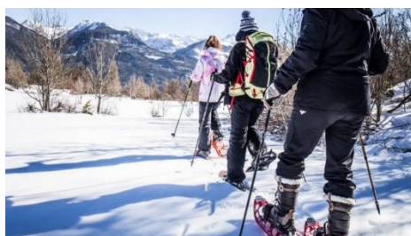
Randonneurs en raquettes

Peut-on faire toutes les activités au même endroit dans la montagne ?