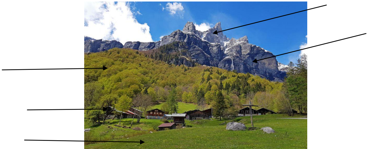
45. paysage de montagne

Il nous a aussi expliqué que la montagne était étagée, et que chaque étage était différent car plus on monte plus il fait froid, donc on ne trouve pas la même végétation, le paysage est différent.