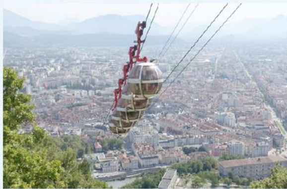
b Un téléphérique à Grenoble