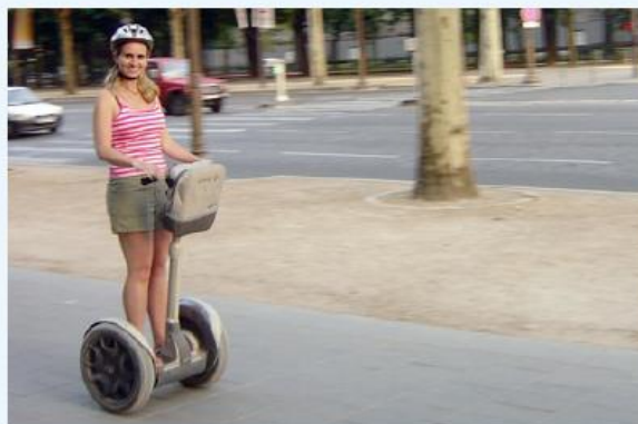
c Un Segway

Le Segway est un véhicule électrique pour une personne. Il se compose d'une plateforme encadrée par deux roues et d'un grand manche de maintien et de conduite. Le pilote s'y installe debout. Certains modèles peuvent atteindre 20 km/h et possèdent une autonomie de 40 kilomètres.