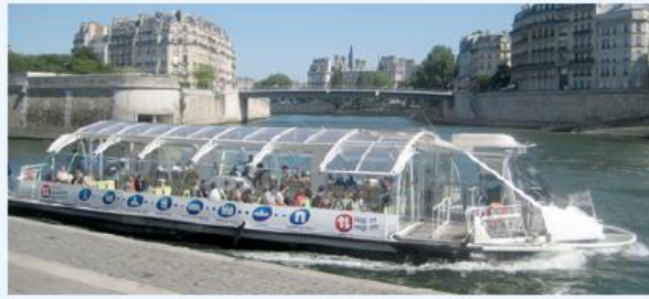
a Un batobus à Paris

Pour se déplacer dans Paris en toute liberté, Batobus a créé une ligne de circulation sur la Seine. Elle dessert 9 stations situées à proximité des grands monuments de la ville. Le billet est valide durant un jour. L'utilisateur monte et descend quand il veut, aussi souvent qu'il veut.