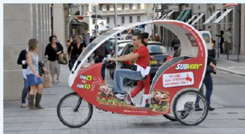
b Un cyclotaxi à Lyon

Vous les avez peut-être déjà croisés dans d'autres villes mais ils sont très présents à Lyon. Ces cyclotaxis vous conduisent où vous voulez pour 1 euro le kilomètre. Écologiques, rapides, silencieux et économiques, ils permettent de voir la ville autrement. Testez-les, c'est vraiment formidable !