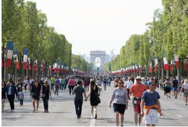
Les Champs-Élysées à Paris

De quel type de document s'agit-il ? C'est une _____