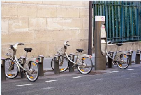
a Une station vélib à Paris

Observe ces documents et réponds aux questions.